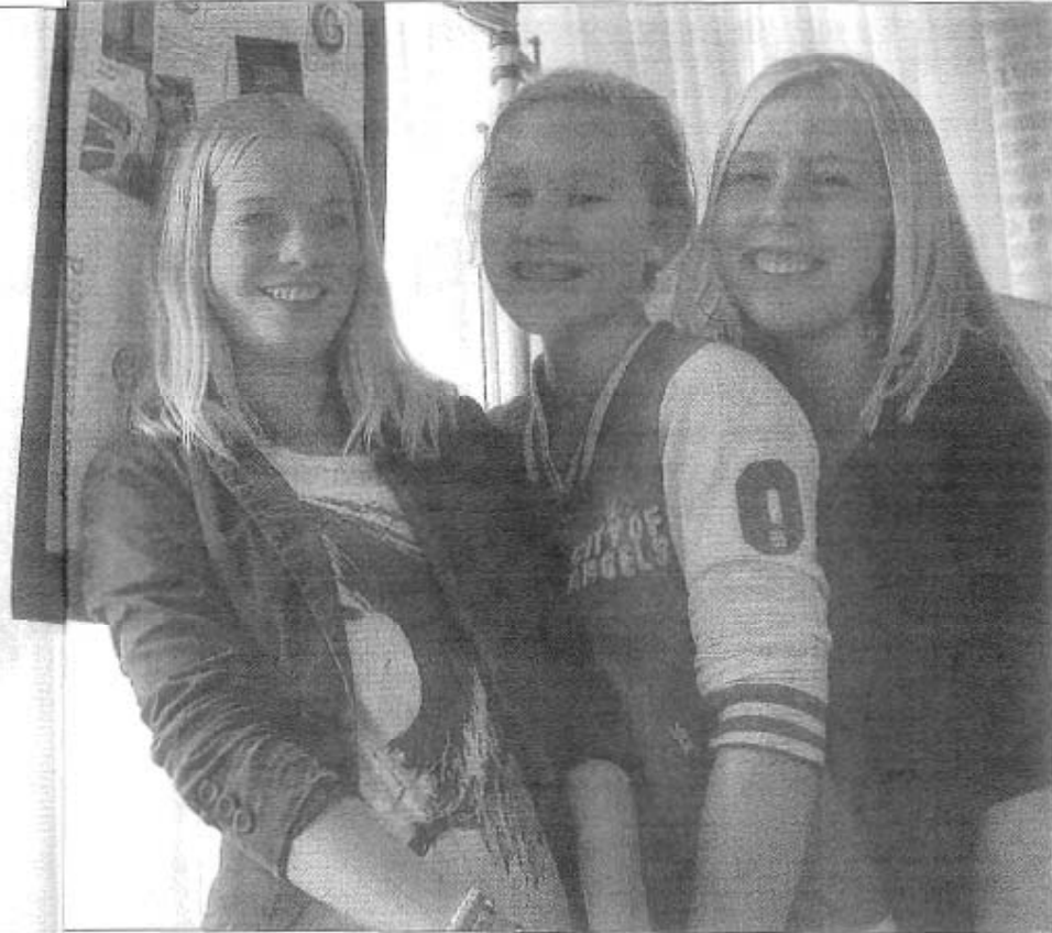
Enkele leerlingen van het Emelwerda College bij de poster met daarop hun bevindingen van duurzaamheid bij bedrijven in de Noordoostpolder.

Duurzaam is niet een synoniem voor biologisch of biologisch dynamisch, benadrukt projectleider Roel Opbroek. „Een gangbare teler die zijn producten direct om de hoek verkoopt, is heel duurzaam bezig.”